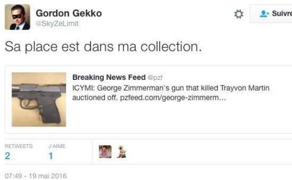
Arme ayant tué Trayvon Martin, un jeune noir américain. Tweet du trader.

On cherche encore le Tweet qui ne pourrait pas être pénalement condamné. Sur les photos, il ressemble à une caricature des jeunesses UMP ou FN. D'ailleurs Alexandre, le bien éduqué, parle un peu comme ses copains du Front. Il préfère ainsi à l'étudiant noir l'arme qui l'a dégommé. Il n'aime pas les femmes libres. Ne supporte pas les homosexuels, les roumains, les musulmans, les grévistes, les jeunes, les intellectuels et les pauvres.