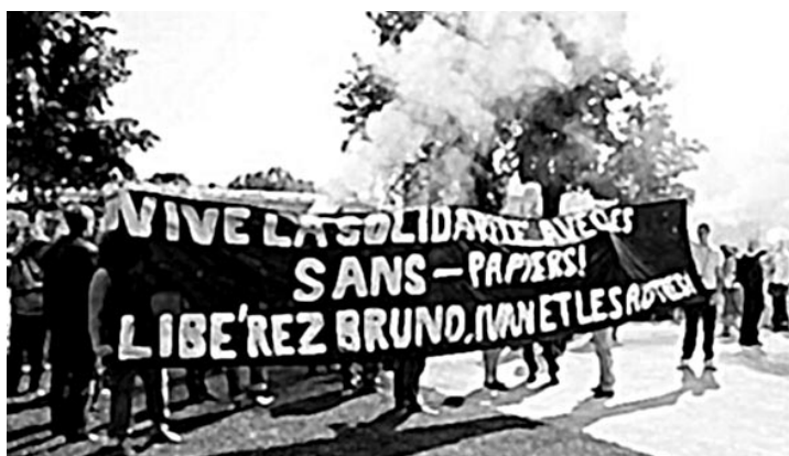
GRENOBLE, 13 MAI