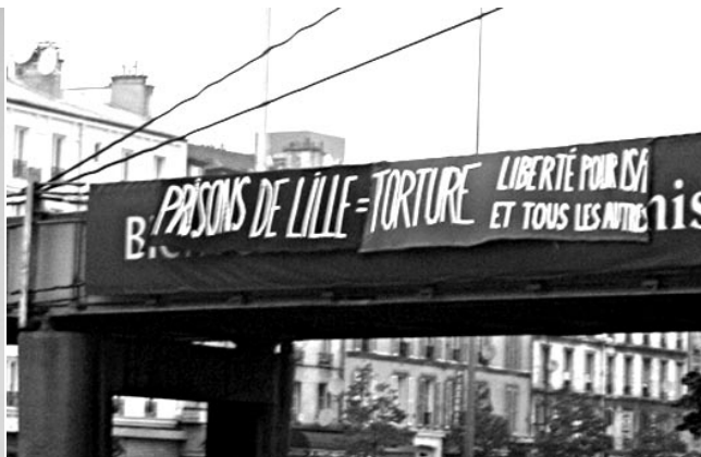
PARIS, 9 JUIN