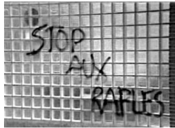
BRUXELLES, 13 JUIN