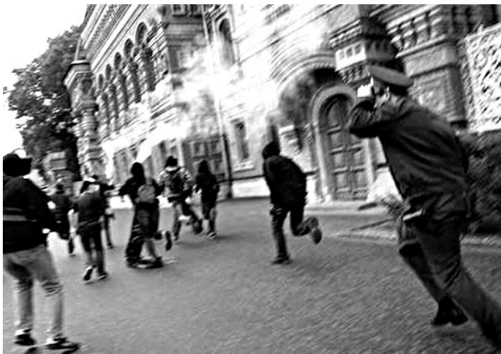
MOSCOU, 11 JUIN

« Dans la nuit du jeudi 12 au vendredi 13 juin, deux entreprises collaborant avec l'État ont été attaquées à Paris. Dans le IX e arrondissement, rue du Faubourg-Poissonnière, une agence Air France a eu toutes ses vitrines brisées et un slogan a été tagué dessus : « SABOTONS LA MACHINE À EXPULSER ». Air France prend en charge volontairement l'expulsion de la plupart des sans-papiers arrêtés.