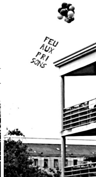
ROUEN, 2 SEPTEMBRE