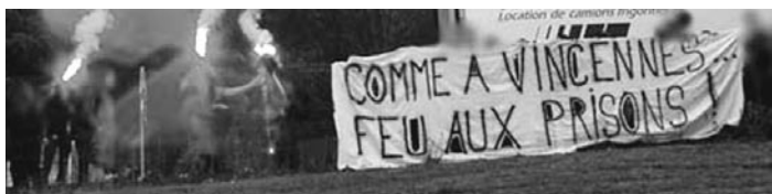
FRESNES, 2 JUILLET

Sète, 14 h, un cortège commence à se constituer. Une demi-heure plus tard, il s'ébranle et parcourt les rues du centre-ville. Il se dirige alors vers le centre de rétention au son de slogans comme « Pierre par pierre, mur par mur, détruisons les centres de rétentions (ou toutes les prisons) », « Ni prisons, ni frontières, ni centres de rétentions » ou « des papiers pour tous (ou pour personne !) ». Passant par le quartier alloué aux immigrés, des rencontres se font. Petit à petit le cortège grandit. C'est environ 150 personnes qui se retrouvent devant le centre de rétention de Sète. Là, un vacarme de ¾ d'heure vient saluer les sans-papiers enfermés (au nombre de 5 à ce moment, cantonnés dans une pièce d'où il leur est impossible de communiquer avec l'extérieur). Les slogans répondent aux pétards et fusées. Le portail est repris aux flics et sera tambouriné pendant un long moment... sans céder ! Le cortège repart alors en direction du port, laissant derrière lui quelques traces de son passage (tags, collages...). Un bateau de la compagnie COMANAV est à quai. Celle-là même qui régulièrement collabore avec l'État pour les expulsions. Les vigiles s'empressent de fermer la plateforme d'accès. Des tracts sont alors distribués aux personnes embarquant. Le cortège repart ensuite vers le centre-ville, avant de se disperser.