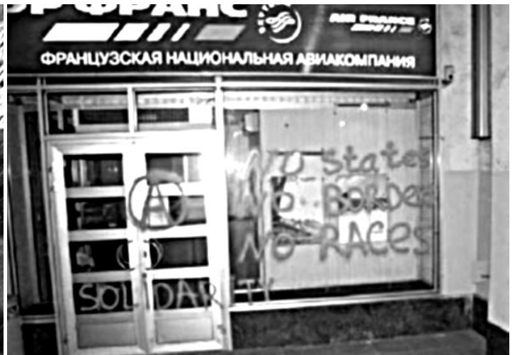
MOSCOU, 13 JUIN

Dans le XX e , rue des Pyrénées, c'est une agence Bouygues Telecom (l'entreprise Bouygues étant l'un des principaux constructeurs de prisons et de centres de rétention) qui a eu ses vitrines endommagées et taguées « FEU AUX PRISONS ». Rappelons que l'agence Air France du Faubourg-Poissonnière avait déjà été attaquée de manière similaire il y a deux mois. Continuons à harceler les entreprises qui font leur fric en construisant des prisons ou en expulsant des sans-papiers !