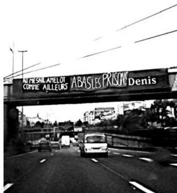
PARIS, 2 SEPTEMBRE

À 9 h, des prisonniers et prisonnières de Rouen ont pu voir une banderole « FEU AUX PRISONS » flotter dans les airs et voir et entendre peu après des pétards et des feux d'artifice.