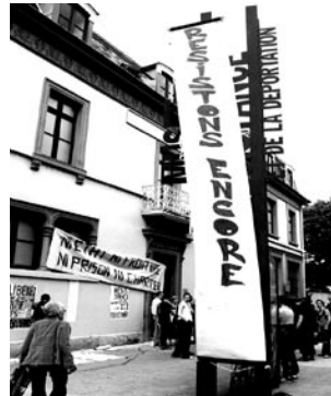
GRENOBLE, 11 JUIN