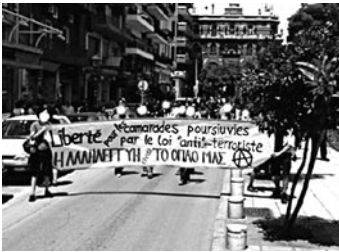
THESSALONIQUE, 13 JUIN