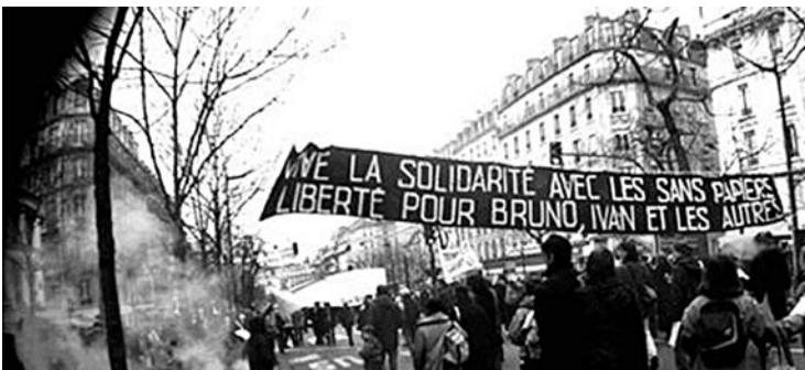
PARIS, 5 AVRIL