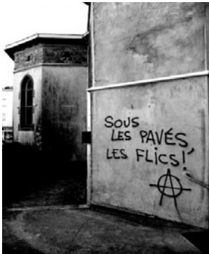
BREST, 9 JUIN

Rassemblement à 13 h 30 devant la préfecture puis occupation pendant quelques heures du musée de la Résistance par une cinquantaine de personnes. Des banderoles « Solidarité avec les sans-papiers », « Résistons encore ! » ou « Ni prison, ni frontières, ni matons, ni charters » ont été déployées sur sa façade, et de nombreux tracts distribués.