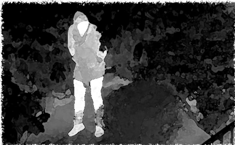
Exemple d'image de caméra thermique

La dernière personne comparaisait pour complicité et subornation de témoin, deux chefs de prévention qui sont tombés avec le discrédit du témoin en question au cours du procès.