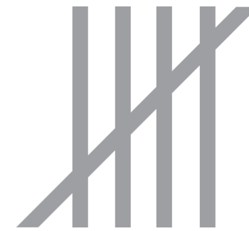
POSITIF 45% NOIR